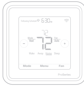
*TH6320ZW2003 depicted. Actual size 4.09" x 4.09" x 1.06"