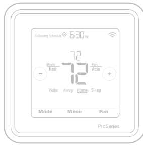
*representado como TH6320ZW2003. Tamaño real 4.09" x 4.09" x 1.06"