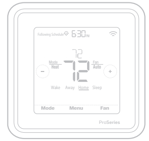
*TH6320ZW2003 montré. Dimensions réelles 4,09x4,09x1,06 po

Veillez lire le mode d'emploi et le conserver en lieu sûr